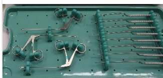
Bandeja em PPSU autoclavável H49-BDJ-BG