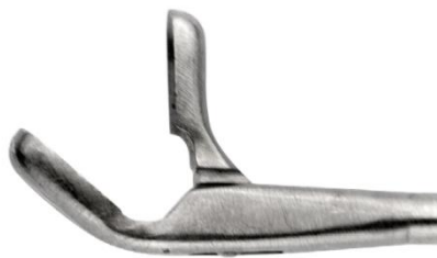
Fórceps Copo Oval, 45° para cima (02-082-12) 02-082-22