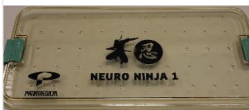
Tampa em PPSU autoclavável – trava e fechamento H49-TP-AB