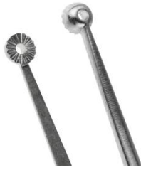
Fórceps Tumor, Baioneta, 3mm diâmetro, Flat Handle 02-082-44