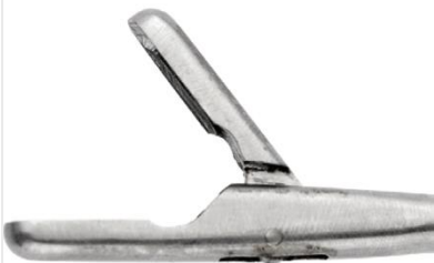
Fórceps Copo Oval, reto (02-082-13) 02-082-23