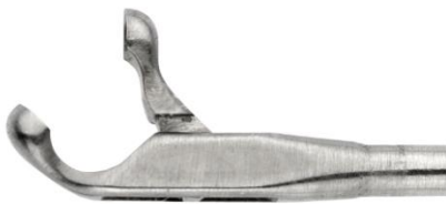
Fórceps Copo Decker, 45° para cima, redondo (02-082-01) 02-082-20 Ponta de 2 mm