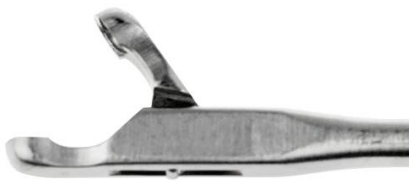
Rounger Decker, 2mm x 11 cm Round Cup, Reto 02-082-47