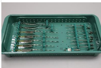
Caixa em PPSU autoclavável H49-70-CX-BG